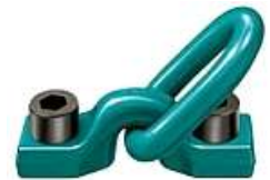
GK 10 - Nur mit Innensechskantschrauben verwendbar