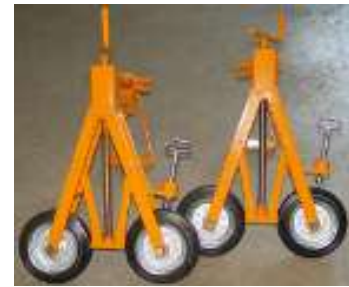
18910135 / 18910136

Um Ihnen das richtige Einhängewerkzeug anbieten zu können, benötigen wir die Bezeichnungen der zu hebenden Deckel (Kanal oder Schacht)