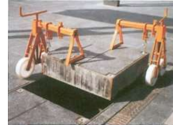
18910140 / 18910141