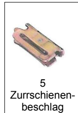
5 Zurrschienen- beschlag