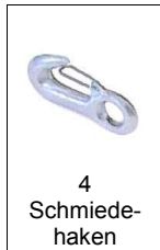
4 Schmiede- haken